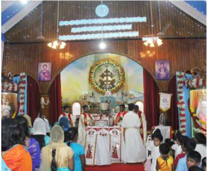
இறையருள் ஏப்ரல்-மே 2020

ஆண்டு தொடக்க விழாவானது நடத்தப்பட்டது. திருப்பலி, ஆன்மிக நிகழ்வுகள் அனைத்திற்கும் ஆயர் அவர்கள் தலைமை ஏற்றார். மறைவட்ட அருட்தந்தையர்கள்