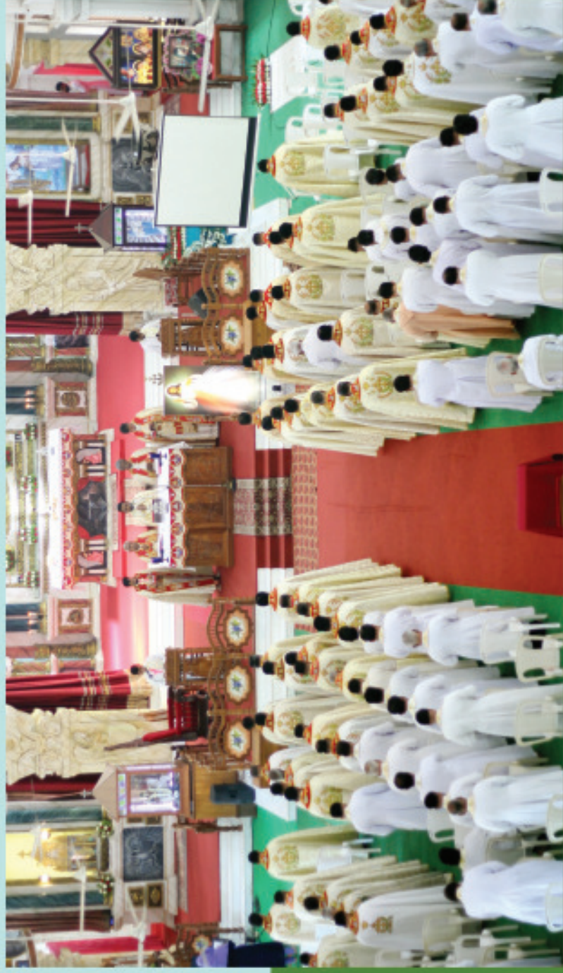
◀ വൈദികരുടെ പൊതുഭാഗസ ധ്യാനം ▶