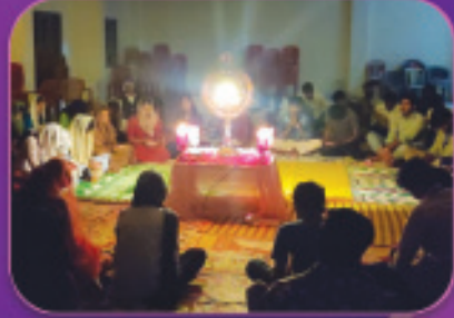
കെ.സി.വൈ.എം യുവാജന യുഗ്മം