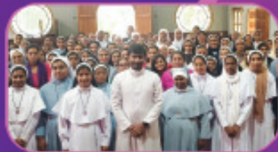
ആനിക്കോട്ടപ്പൻ മീറ്റിംഗ്, തിരുബാലസലൂം