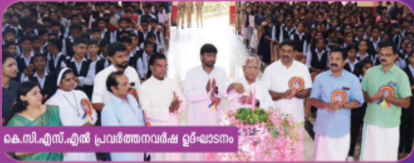
കെ.സി.എസ്.എൽ പ്രവർത്തനവർഷ ഉദ്ഘാടനം