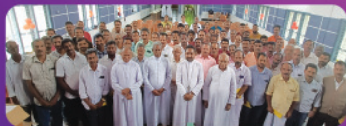
ദൈവാലയ ശുശ്രൂഷികളുടെ സംഗമം, അടിമാലി