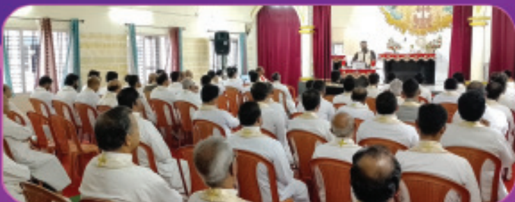
രൂപതാ വൈദികരുടെ വാർഷിക ധ്യാനം