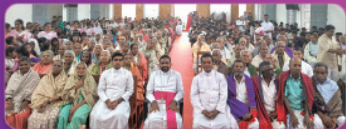
ലോക വയോജന ദിനാചരണം, തങ്കമണി