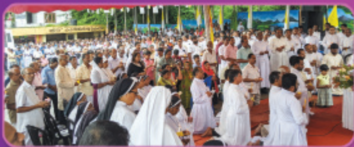
മണിപ്പൂരിനുവേണ്ടി പ്രാർത്ഥനയോടെ ഇടുക്കി രൂപത