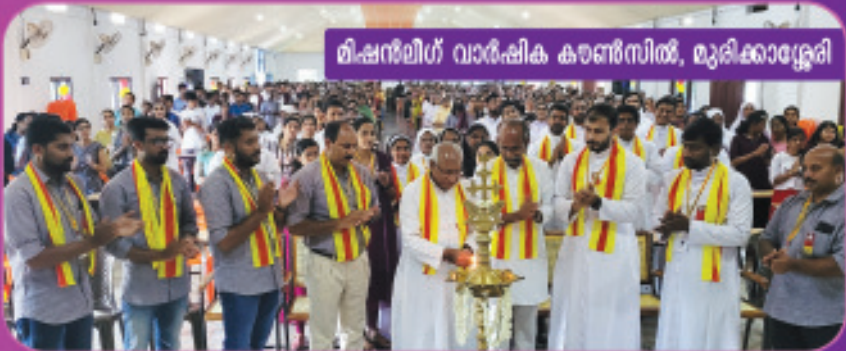
മിഷനറിമാർ വാർഷിക കൗൺസിൽ, മുരിങ്ങാശ്ശേരി