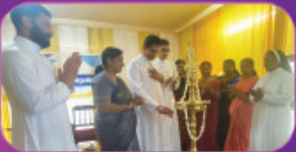
രാത്രിവേദി പ്രവർത്തനവർഷ ഉദ്ഘാടനം