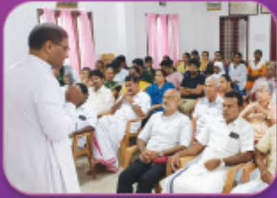
നേതൃത്വ സംഗമം, ജലവിദ്യാലയ സെമിനാർ