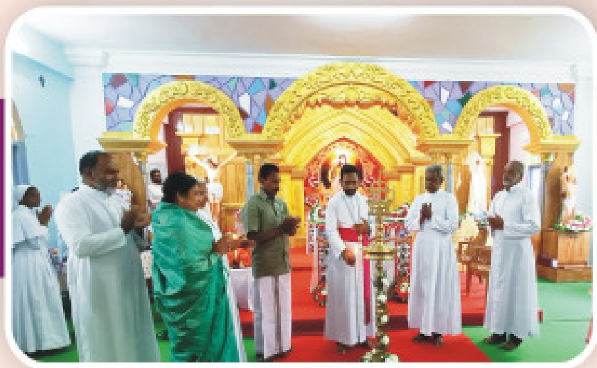
കരൂണ ആനിമേഷൻ സെന്ററിന്റെ ഉദ്ഘാടനം