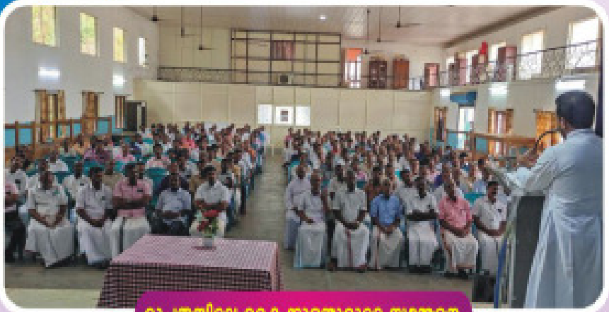
രൂപതയിലെ കൈകാര്യം സമ്മേളനം