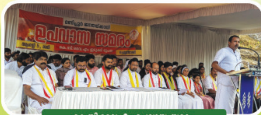
കെ.സി.ഡെ.എം ഉപവാസ സമരം