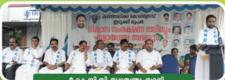
എ.കെ.സി.സി സ്വാതന്ത്ര്യ സമരസ്ത്വ