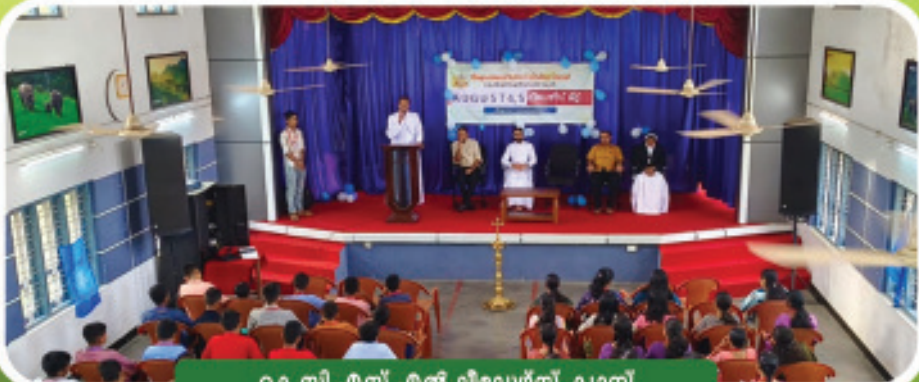
കെ.സി.എസ്.എൽ ലീഡേഴ്സ് ക്യാമ്പ്