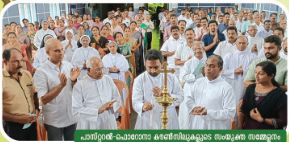
പാസ്റ്ററൽ-ഫോറോനാ കൗൺസിലുകളുടെ സംയുക്ത സമ്മേളനം