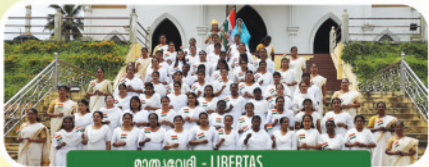
മാതൃവേദി - LIBERTAS