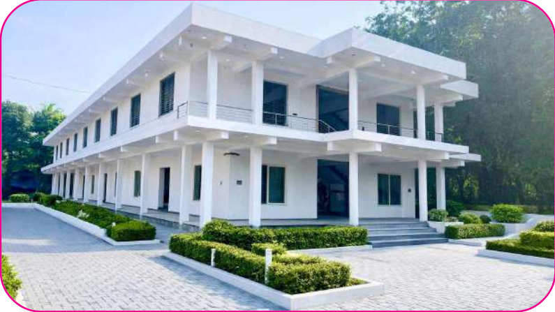
Thotathady : Newly Built Community Hall 10.05.2026