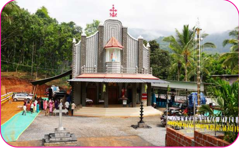
Ellukochi : Newly Built Church 16.05.2026