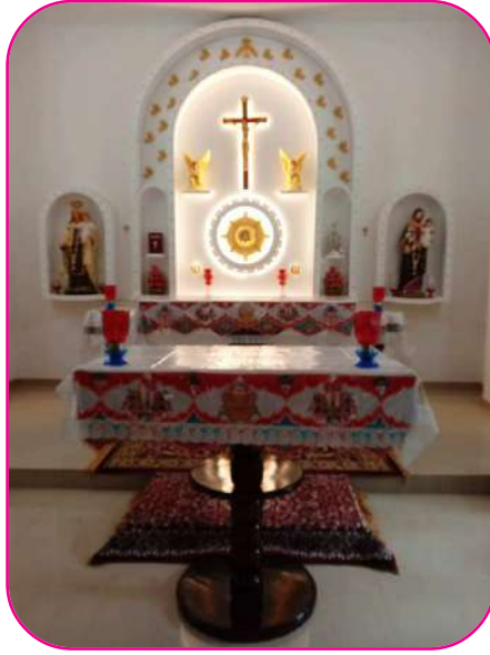
Mundaje : Newly Built Convent 09.05.2026