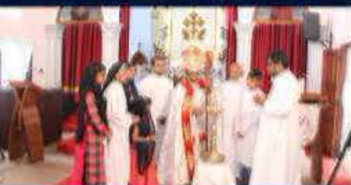
14.06.2020 INAUGURATION OF CATECHETICAL YEAR 2020-2021