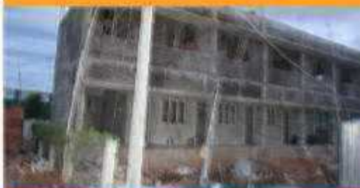
13.09.2020 TAILORING CENTRE MADURAI - VISIT BY BISHOP