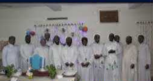
22.09.2020 - CMI FATHERS FAREWELL