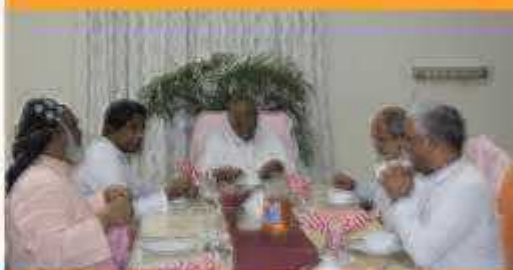
BISHOPS OF KK MEET, BISHOP'S HOUSE, THUCKALAY