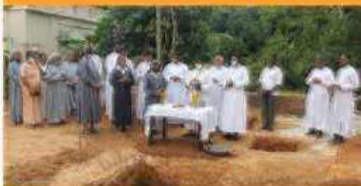
02.09.2020 - FOUNDATION STONE MMM SISTERS, PADANTHALUMOODU