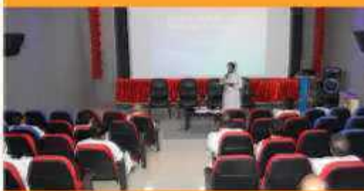
09.09.2020 - SILVER JUBILEE ACTION PLAN DISCUSSION PADANTHALUMOODU FORANE