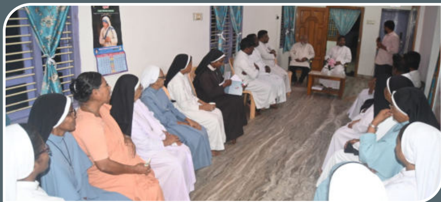
TENKASI MISSION MEET, NOVEMBER 25, 2024, AMBUR