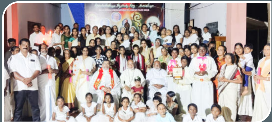
SILVER JUBILEE INAUGURATION, NOVEMBER 21, 2024, ST. BENEDICT'S CHURCH, BENGIRI