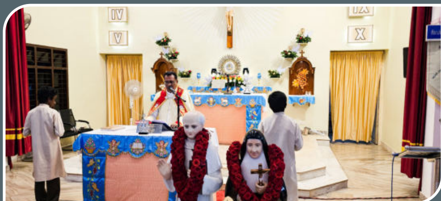
10 TH ANNIVERSARY OF THE CANONISATION OF ST. CHAVARA KURIAKOSE ELIAS & ST. EUPHRASIA, NOVEMBER 24, 2024, KALIYAL