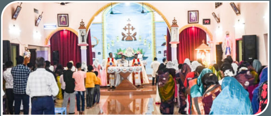
DIOCESAN DAY (PARISH-LEVEL) CELEBRATION, NOVEMBER 10, 2024, PALLIKONAM