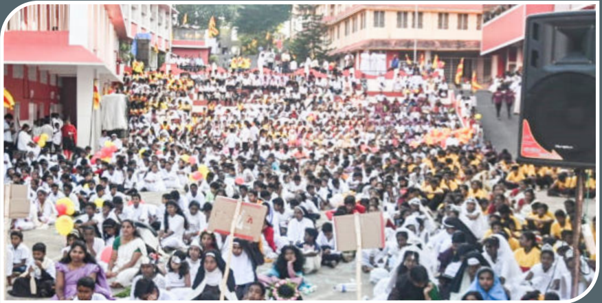
MISSION LEAGUE RALLY, NOVEMBER 17, 2024, THIRUTHUVAPURAM TO PADANTHALUMOODU