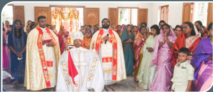
FEAST MASS , NOVEMBER 24, 2024, CHRISTHURAJAPURAM