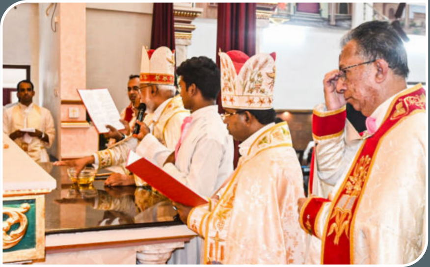
CHURCH CONSECRATION, NOVEMBER 16, 2024, PARAICODE