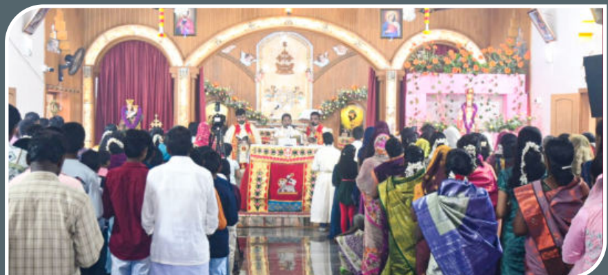
FEAST MASS , NOVEMBER 24, 2024, PALAPALLAM