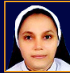
SR. LEEMA FCC