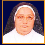
SR. CLARELET CMC