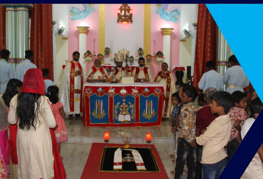
15 AUGUST 2019 REMEMBRANCE HOLY QURBANA, MALAICODE