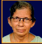
SR. TESSY SDS