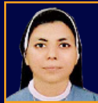
SR. SIMI SJSM