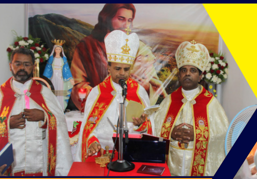
12 AUGUST 2019 BLESSING OF NEW MISSION STATION, CUMBAM