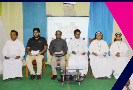
11 AUGUST 2019 MEDICAL CAMP PUDUR