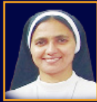
SR. SOONA CMC