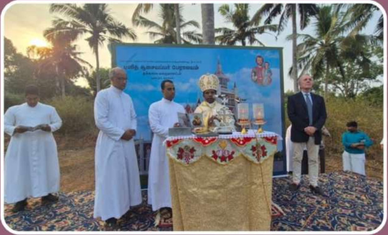
Adoration and Blessing of Foundation Stone for Cathedral Soosaipuram