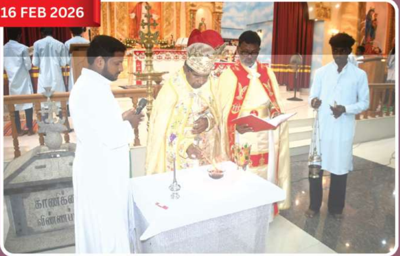
Ash Monday Holy Qurbana at Kaisalavilai