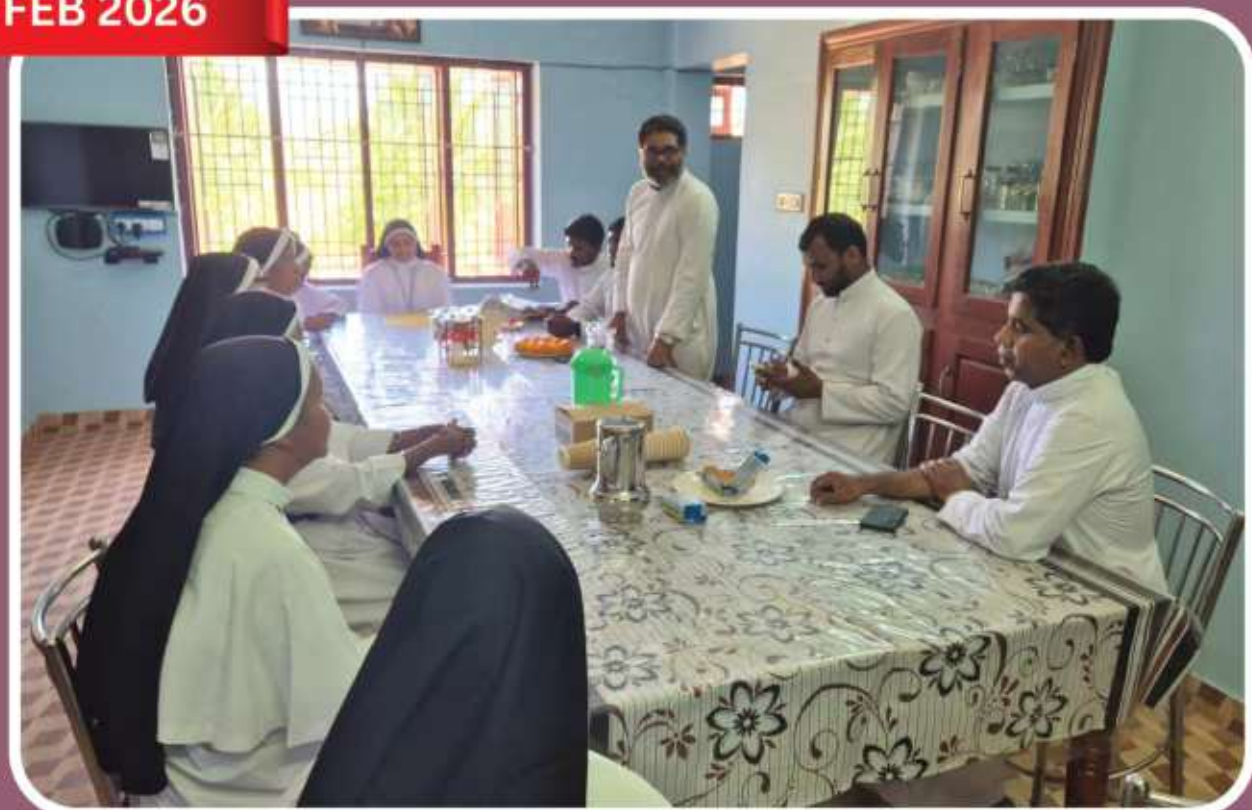
Kayathar: Extended territory missionaries meet