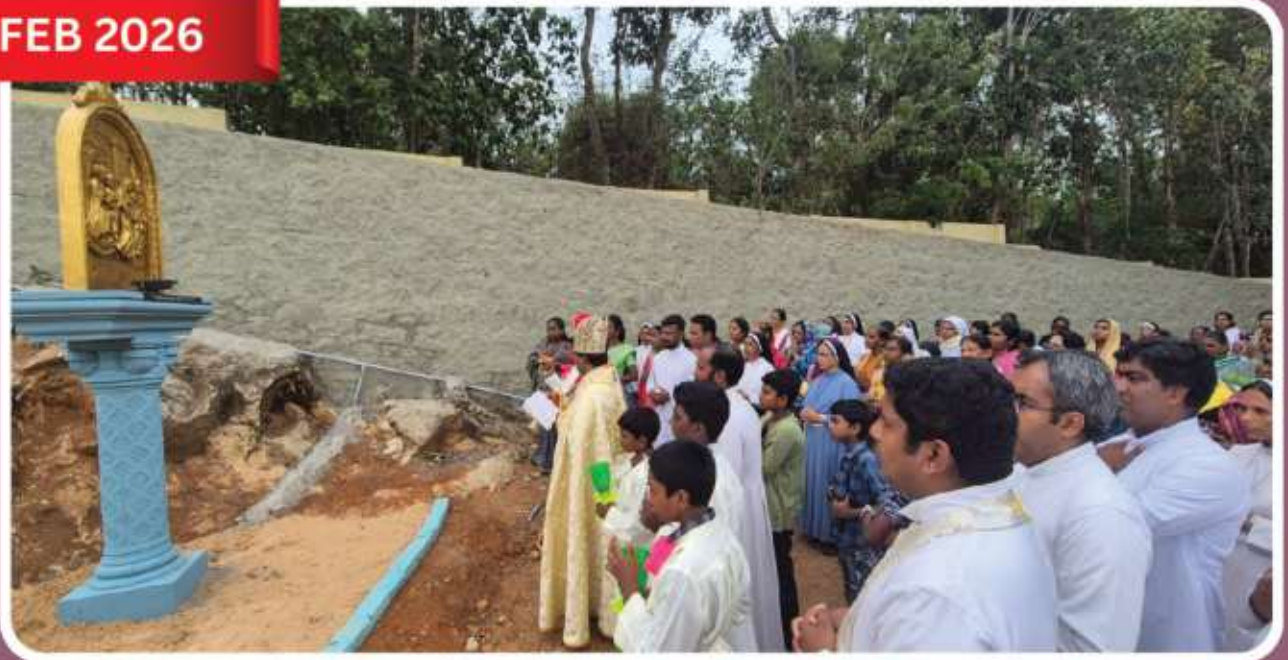
Holy Qurbana and blessing at Sinai Retreat Center