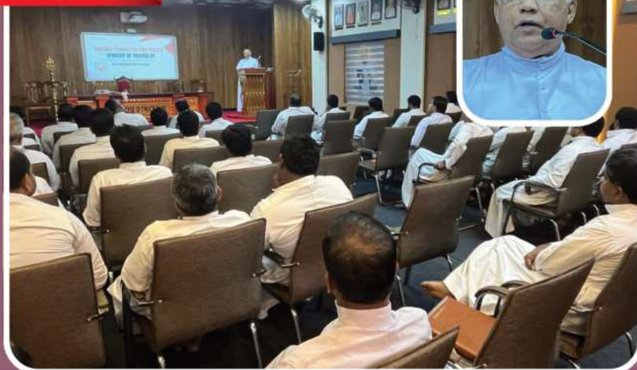
Priests ongoing formation programme at Sangamam