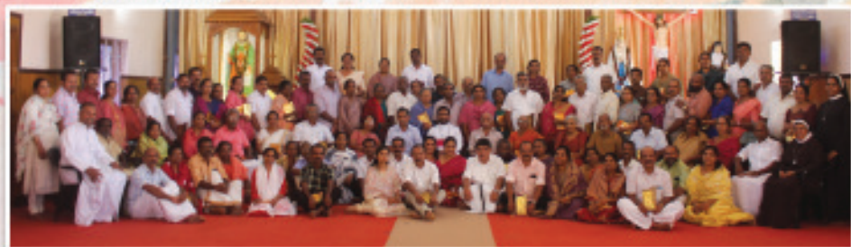
സെന്റ് തോമസ് ഫൊറോനാ ദൈവാലയം ചുരുളി