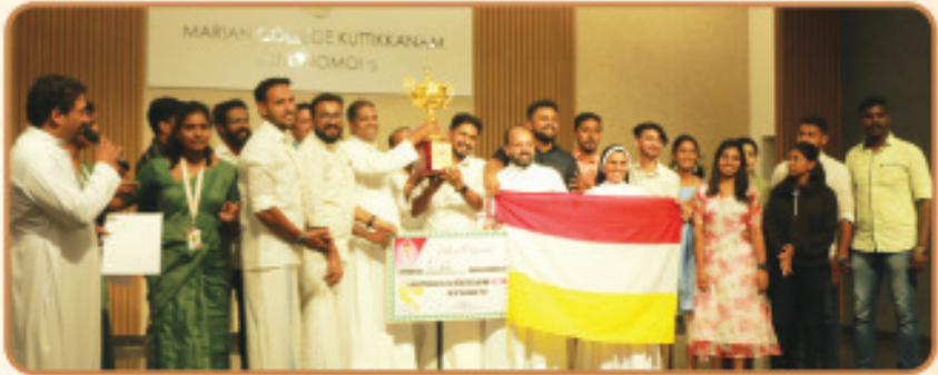
കെ.സി.വൈ.എം സംസ്ഥാന കലോത്സവത്തിൽ കെ.സി.വൈ.എം ഇടുക്കി രൂപതയ്ക്ക് രണ്ടാം സ്ഥാനം