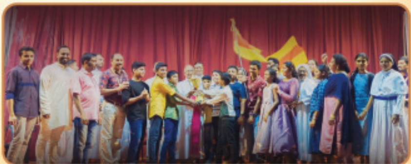
മിഷൻലീഗ് സംസ്ഥാന കലോത്സവത്തിൽ മിഷൻലീഗ് ഇടുക്കി രൂപതയ്ക്ക് മൂന്നാം സ്ഥാനം