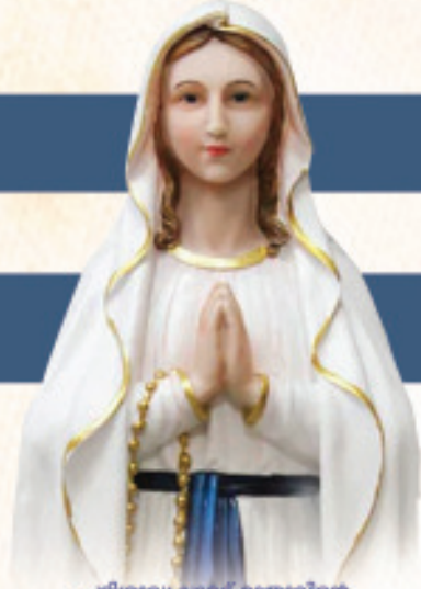
പരിശുദ്ധ ലൂർദ്ദ് മാതാവിന്റെ തിരുനാൾ