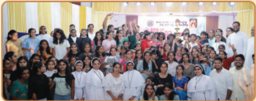
കെ.സി.എസ്.എൽ സംസ്ഥാന കലോത്സവത്തിൽ കെ.സി.എസ്.എൽ ഇടുക്കി രൂപതയ്ക്ക് രണ്ടാം സ്ഥാനം