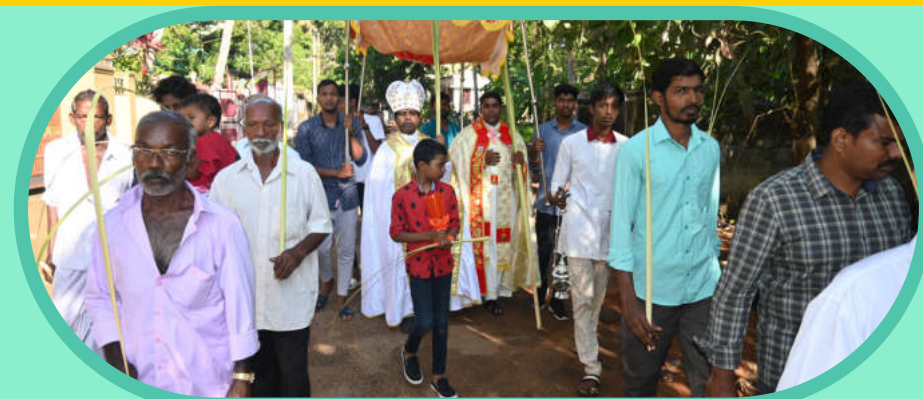
Palm Sunday Celebration, Thackalivilai 10.04.2022