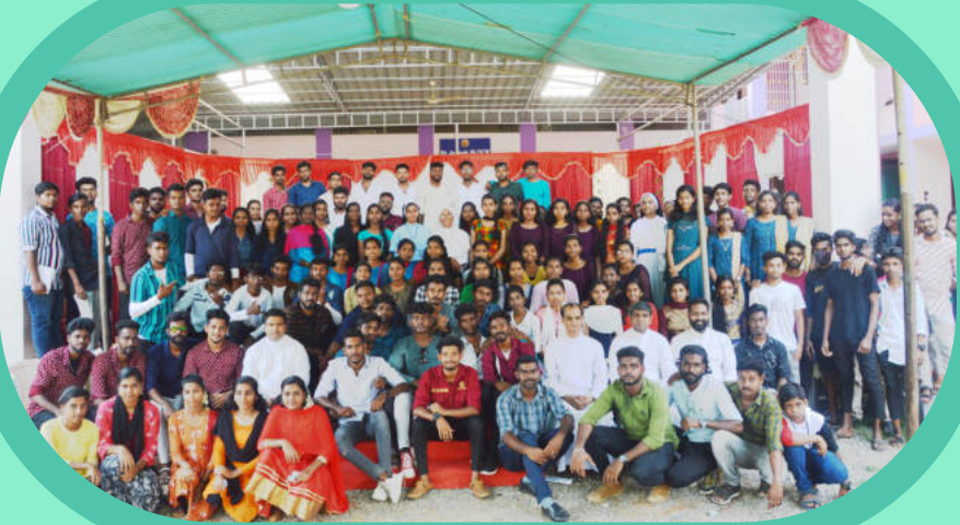
YOUTHFEST 2k22, Finale, 30.04.2022, Manjalumoodu