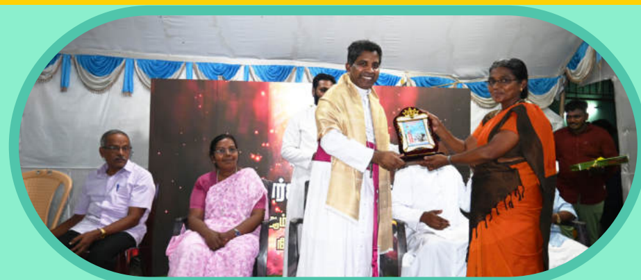
Golden Jubilee of St. George Church, Munchirai, 24.04.2022