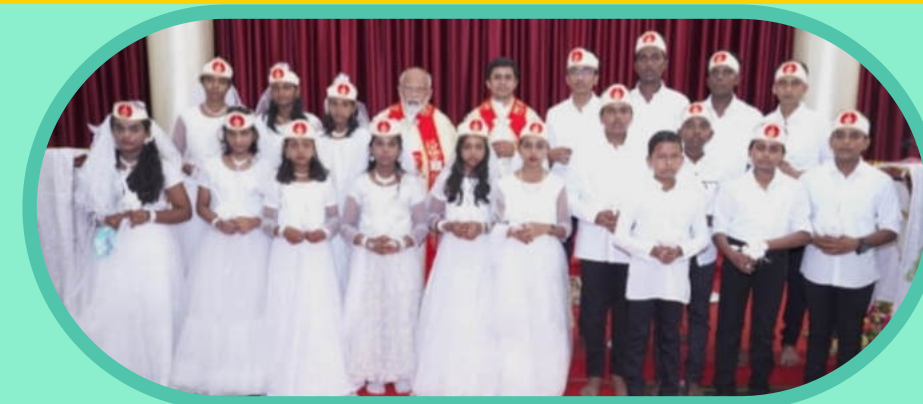
First Holy Communion, Padanthalumoodu, 24.04.2022