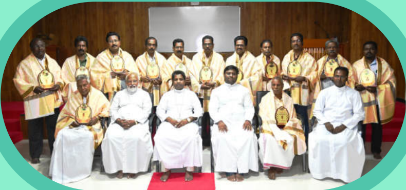
Catechism, Farewell to Outgoing Promoters 04.04.2022, Sangamam