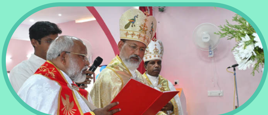
St. George Mission, Viruthunagar, Church Consecration, 03.04.2022