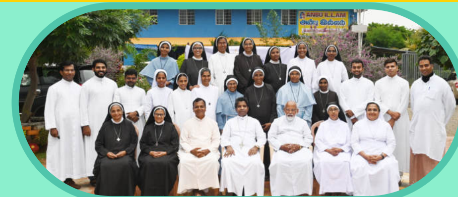
Missionaries Meet, Thenkasi, 22.04.2022