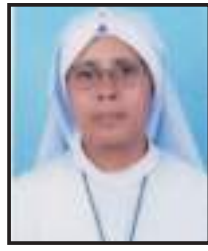
സി. ജെയ്ത്സലദ് എസ്.ഡി