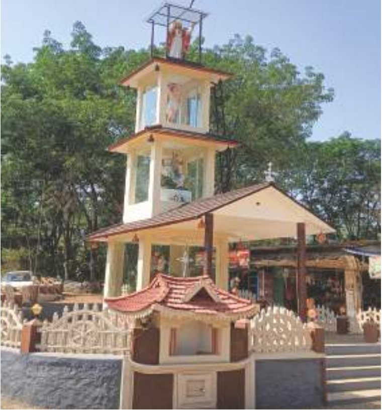
ആനക്കുളത്ത് പുതുതായി നിർമ്മിച്ച കുരിശി