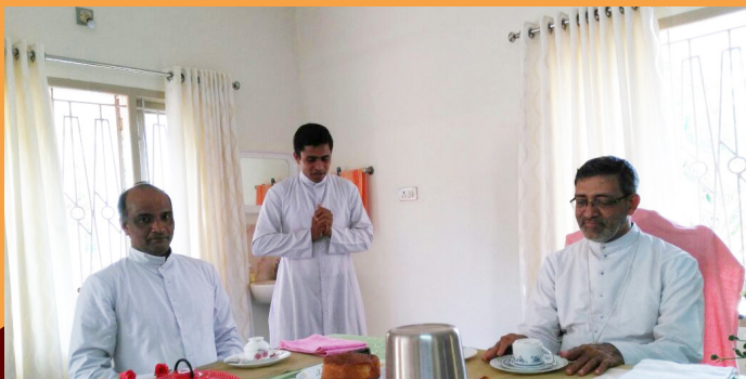
VISIT BY PAUL ALAPATT BISHOP OF RAMANATHAPURAM - JUNE 29