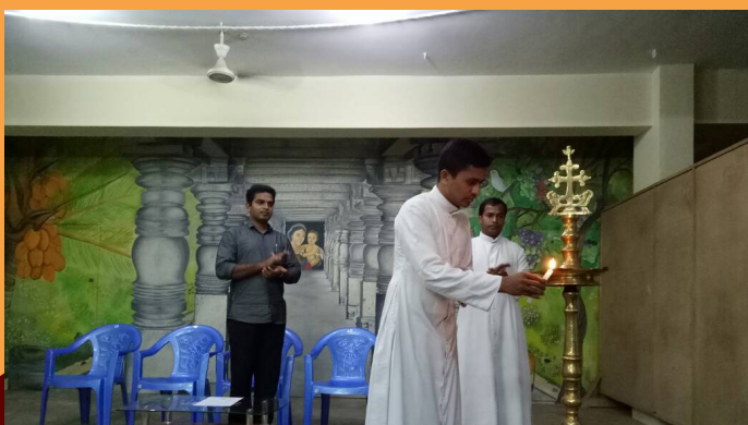
MINOR SEMINARY ACADEMIC YEAR INAUGURATION - JUNE 09