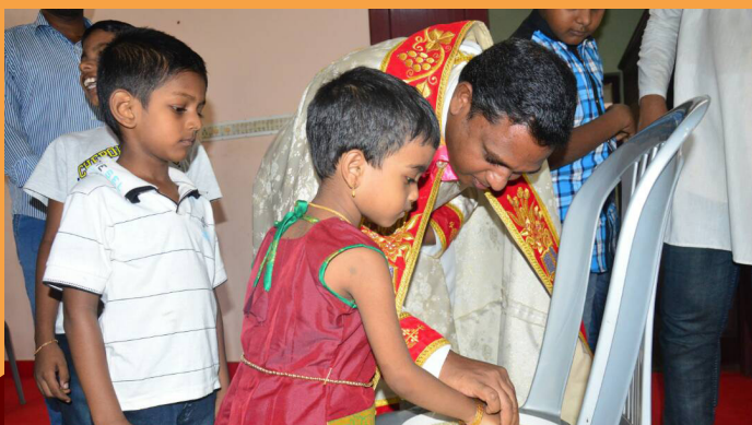
CATECHISM INAUGURATION 2017-2018 KALLUVILAI - JUNE 04