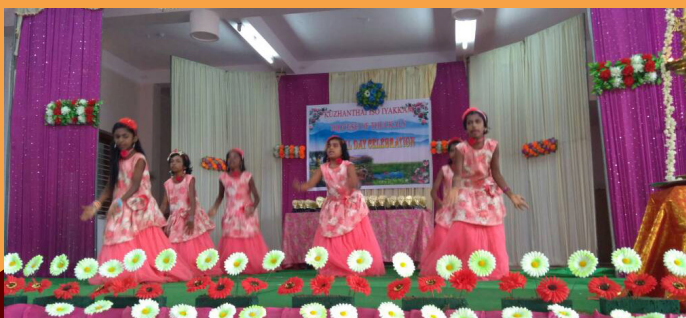
KUZHANDAI ISO IYAKKAM ANNIVERSARY - JUNE 03