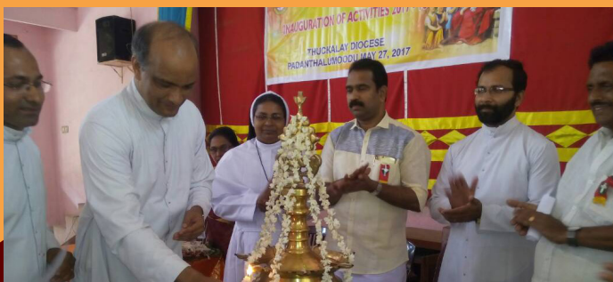
MISSION LEAGUE 2017-2018 INAUGURATION OF ACTIVITIES IN TAMIL NADU - MAY 27