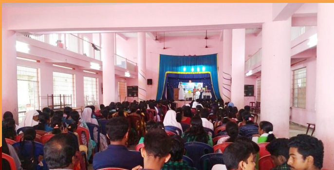
MISSION LEAGUE ANNIVERSARY - JUNE 25