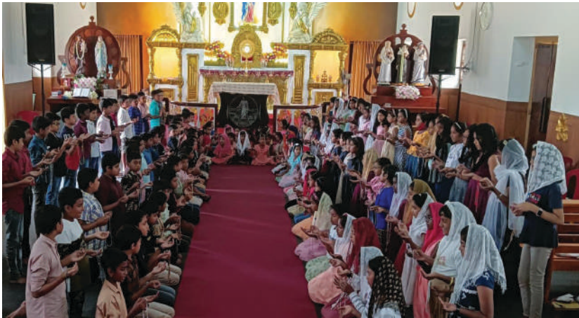
രാജകുമാരി ദൈവമാതാ പള്ളിയിൽ ജപമാല ചൊല്ലി പ്രാർത്ഥിക്കുന്ന കുട്ടികൾ

വത്തിക്കാനിൽ നിന്നും മാർപ്പാപ്പയുടെ നിർദ്ദേശം അനുസരിച്ച് ഒക്ടോബർ പതിനെട്ടാം തീയതി ഇടുക്കി രൂപതയിലെ തിരുബാലസഖ്യം, ചെറുപുഷ്പ മിഷൻലീഗ്, കെ സി എസ് എൽ സംഘടനകളിലെ കുട്ടികൾ ചേർന്ന് 23000 ജപമാല ചൊല്ലി പ്രാർത്ഥിച്ചു. ലോക സമാധാനത്തിനും ഐക്യത്തിനും അതോടൊപ്പം ബുദ്ധിമുട്ടുകൾ നേരിടുന്നവർ ദൈവത്തിൽ വിശ്വസിക്കുവാൻ കുട്ടികളെ പ്രേരിപ്പിക്കുക എന്നീ നിയോഗങ്ങളുമാണ് ജപമാല ചൊല്ലി പ്രാർത്ഥിച്ചത്. തിരുബാലസഖ്യം, ചെറുപുഷ്പ മിഷൻലീഗ് സംഘടനകളിലെ കുട്ടികൾ അവരവരുടെ ഇടവകകളിലും കെ സി എസ് എൽ അംഗങ്ങൾ സ്കൂളുകളിലുമായാണ് പ്രാർത്ഥന നടത്തിയത്. അതോടൊപ്പം ഈ നിയോഗാർത്ഥം വീടുകളിലും അന്നേദിവസം കുട്ടികൾ ജപമാല ചൊല്ലി പ്രാർത്ഥിച്ചു. സഭ ഒരുപാട് വെല്ലുവിളികൾ നേരിടുന്ന ഈ കാലഘട്ടത്തിൽ ജപമാല എന്ന ആയുധവുമായി തിന്മയ്ക്കെതിരെ പോരാടുവാനും പരി. അമ്മയോട് ചേർന്ന് ജീവിക്കുവാനും കുഞ്ഞുങ്ങളെ പ്രാപ്തരാക്കുകയെന്നത് കാലഘട്ടത്തിന്റെ ആവശ്യവും ഒപ്പം അവർക്കൊരു പ്രചോദനവും കൂടിയാണ്.