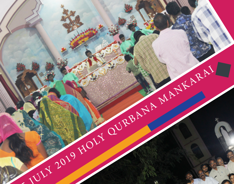
25 JULY 2019 HOLY QURBANA MANKARAI