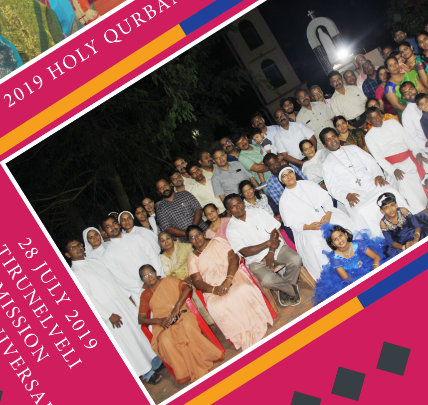
28 JULY 2019 TIRUNELVELI MISSION FIRST ANNIVERSARY