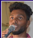
Vice President Starvin