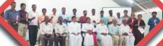
15.08.2020 VINCENT DE PAUL NEW BOARD MEMBERS INSTALLATION