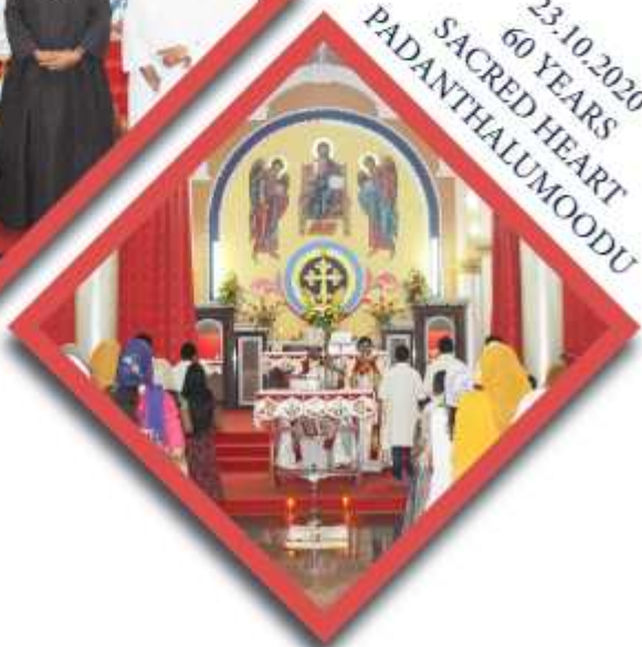
23.10.2020 60 YEARS SACRED HEART PADANTHALUMOODU