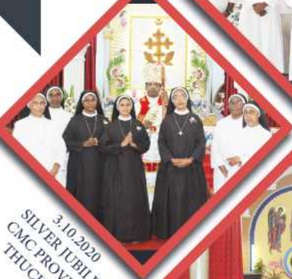
3.10.2020 SILVER JUBILEE CMC PROVINCE THUCKALAY