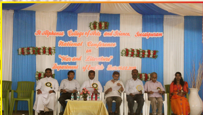
St. Alphonsa College, National Congress on War and Literature, 16.02.2018