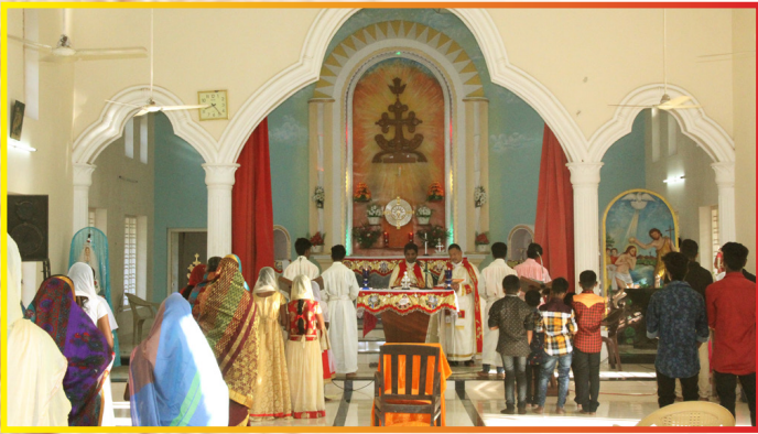
Anamukham Pastoral Visit - 25.02.2018