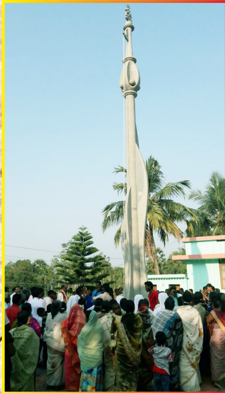
Munchirai, Kodimaram Blessing 17.02.2018