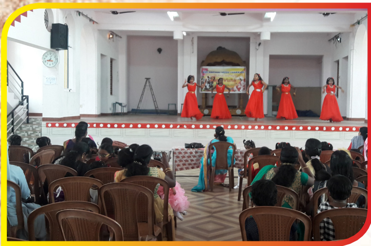
Kuzhandai Iso Iyakkam Competitions 13.02.2018