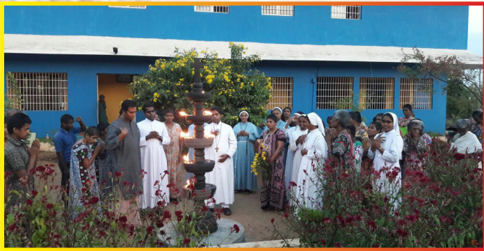
Shenkottai, Anpu Illam Visit - 25.02.2018