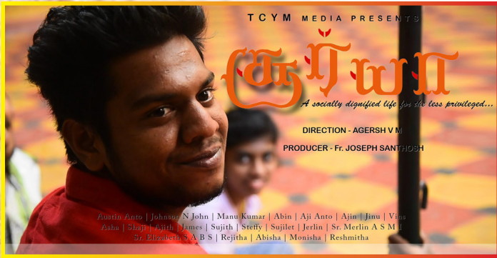
TCYM, Short Film, SURYA , Dedicated to Karunai Illam, Nithiravilai, 24.02.2018