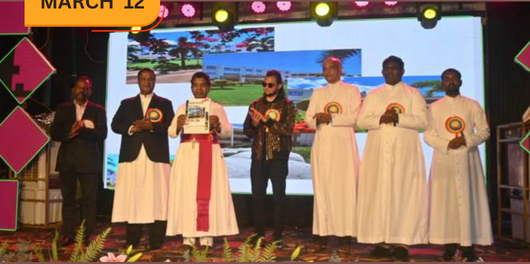
ST. ALPHONSA COLLEGE DAY AT SOOSAIPURAM