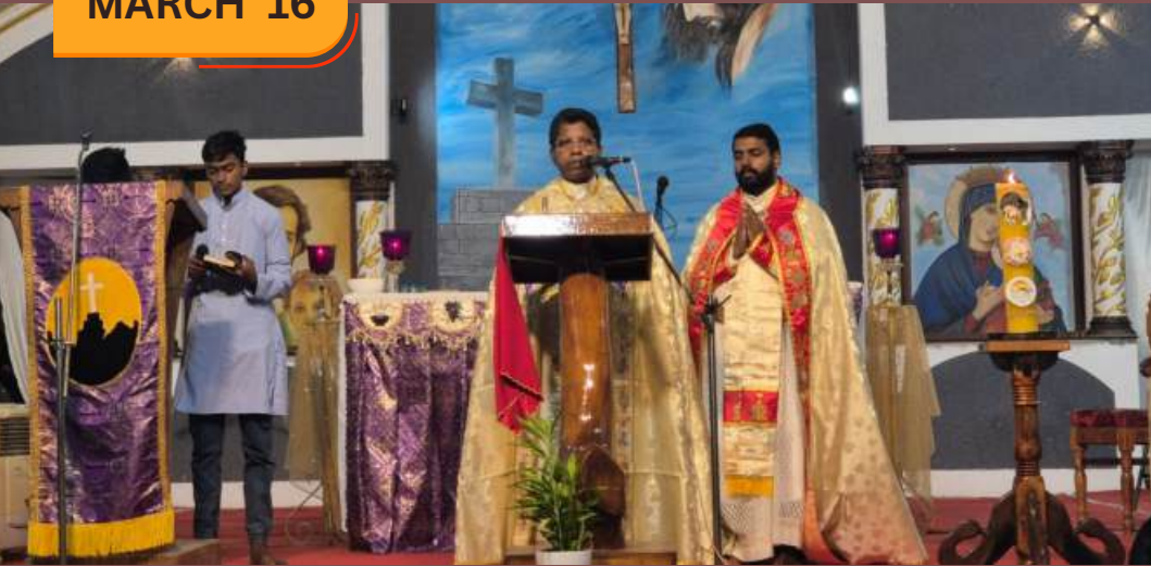
QURBANA AT VELLARADA KURISUMALA