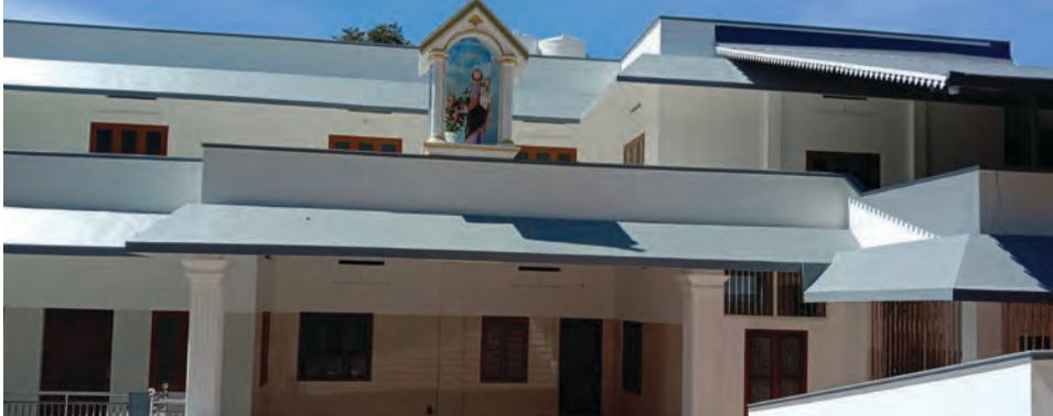
15/11/22 നു അഭി. പിതാവ് വെഞ്ചിരിപ്പ് കർമ്മം നിർവഹിച്ച ഉദയഗിരിയിലെ SD സന്യാസഭവനം