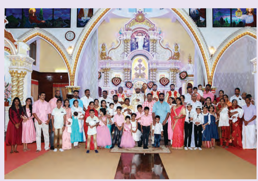
ജോർദാനിയ മിനിസ്ട്രിയുടെ നേതൃത്വത്തിൽ രാജകുമാരി പള്ളിയിൽ നടന്ന പൊതുമാമ്മോദിസായിൽ പ്രാരംഭ കുദാശകൾ സ്വീകരിച്ച 7 കുട്ടികളും കുടുംബാംഗങ്ങളും അഭി. പിതാവിനോടൊപ്പം