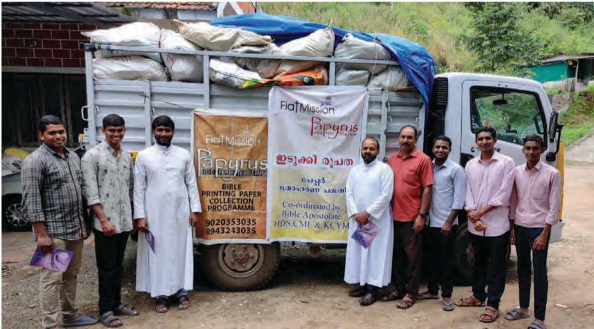
ബൈബിൾ നിർമ്മാണത്തിനായി ഇടുക്കി രൂപത ബൈബിൾ അപ്പോസ്റ്റലേറ്റ് HDS, CML, KCYM എന്നീ സംഘടനകളുടെ നേതൃത്വത്തിൽ സമാഹരിച്ച പേപ്പർ ഫിയാത്ത് മിഷന് കൈമാറുന്നു